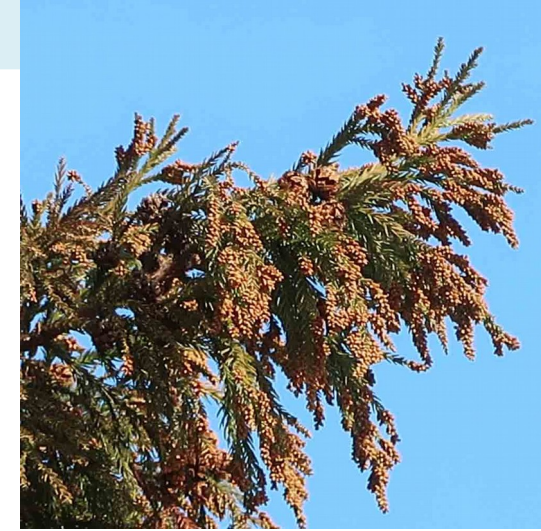
(入間ではスギの雄花が多く着花 しています。1/6/2019)