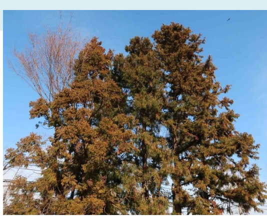
杉並区定点1:杉並区定点1観察の 写真に関し当敷地の執行部および スタッフ方々の御協力により提供して おります。(2019/1/16)

スギの目視観察（杉並区定点）にてスギの雄花が大量とは言えませんが着花しています。入間ではスギの雄花が多く、花粉飛散は決して少なくありませんので例年通りの花粉対策をしてください。