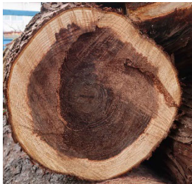
伐採された年月を感じる年輪